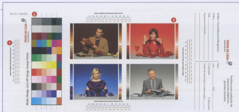
Exemplo de testform com tarja de avaliação colorimétrica e alvos de avaliação física.