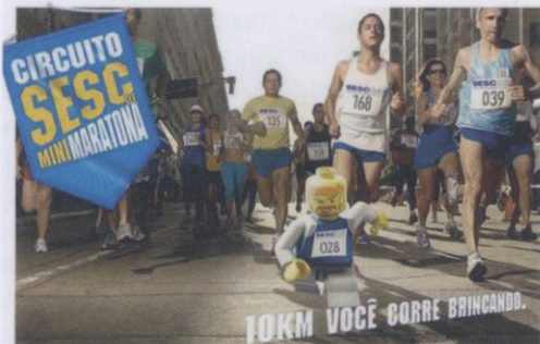
Exemplo de Nível 2: faixas, painéis, banners e cartazes (vistos a uma distância média)

requer boa aproximação na reprodução de detalhes e cores. Os usuários finais observarão o produto a uma distância média em relação a sua diagonal.