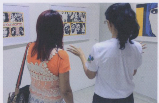
Nível 1- Reproduções de obras de arte para exposição (vistas a uma curta distância)