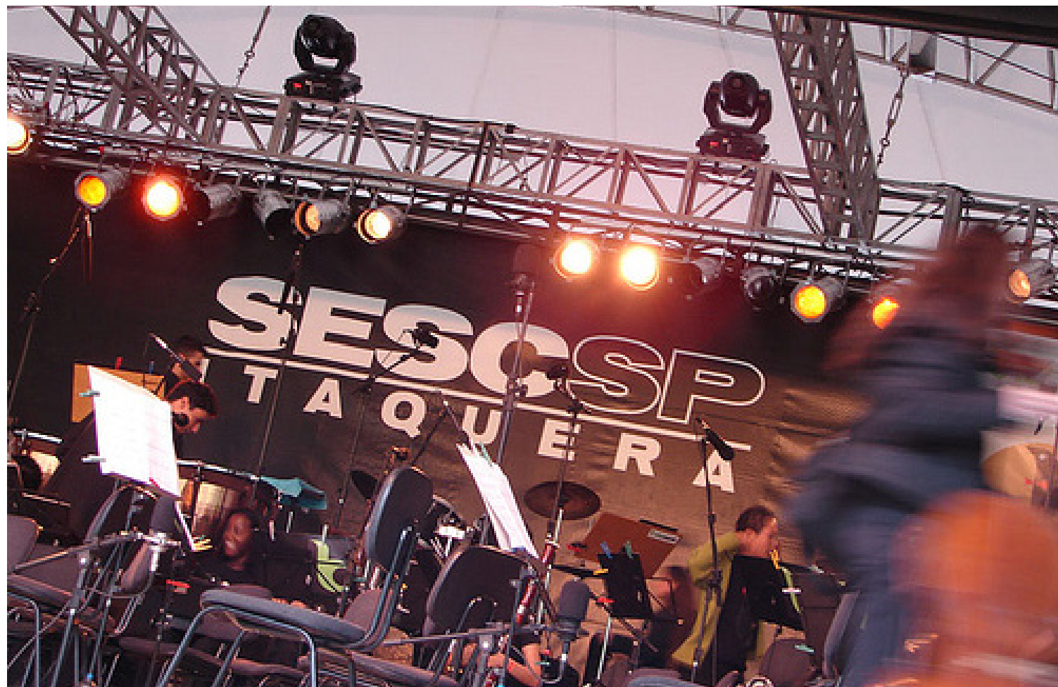
NÍVEL 3: faixas, painéis, banners e cartazes (vistos a uma distância grande)