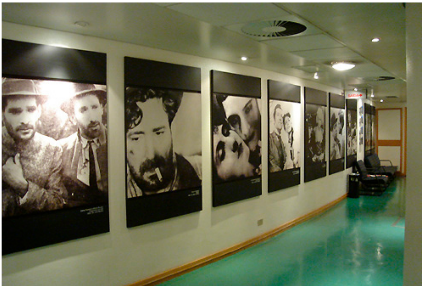
NÍVEL 1 - Reproduções de obras de arte para exposição (vistos a uma curta distância)