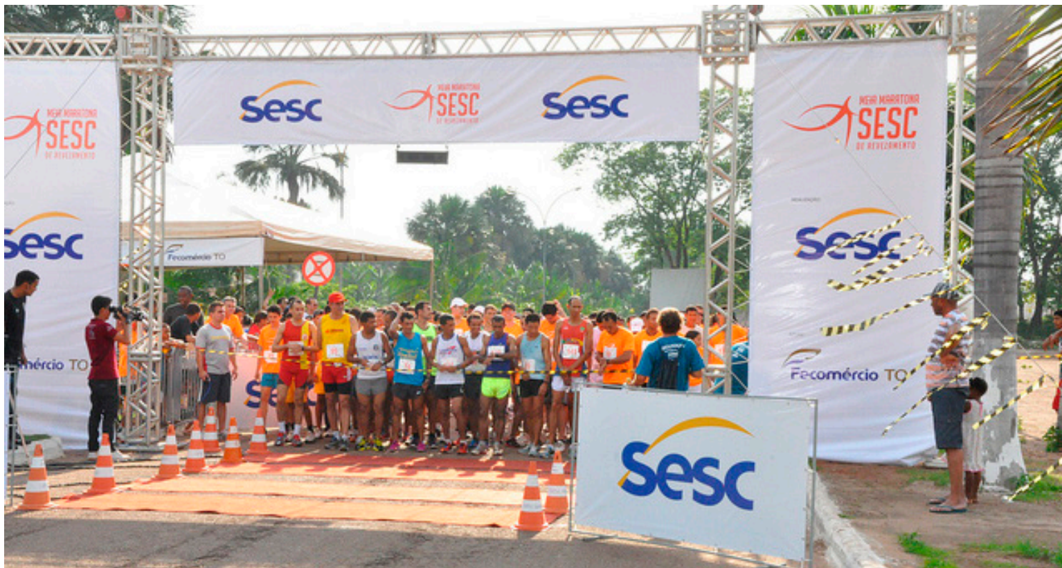
NÍVEL 3: faixas, painéis, banners e cartazes (vistos a uma distância grande)